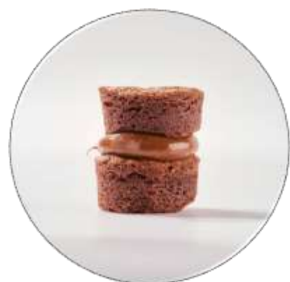
ALFAJOR DE BROWNIE

O alfajor de coco artesanal é uma deliciosa combinação de duas bolachas suaves com coco ralado, recheadas com doce de leite. a sua textura suave e sabor tropical fazem dele uma opção irresistível para os amantes de coco