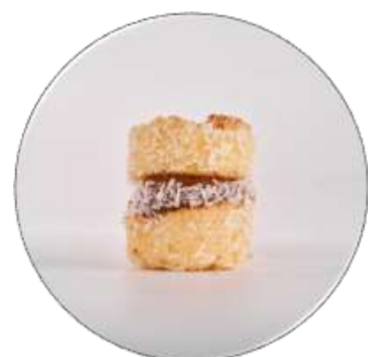
ALFAJOR DE COCO