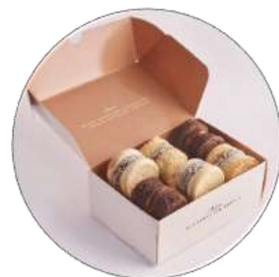
PACK DE 6 ALFAJORES ARTESANAIS MALVÓN