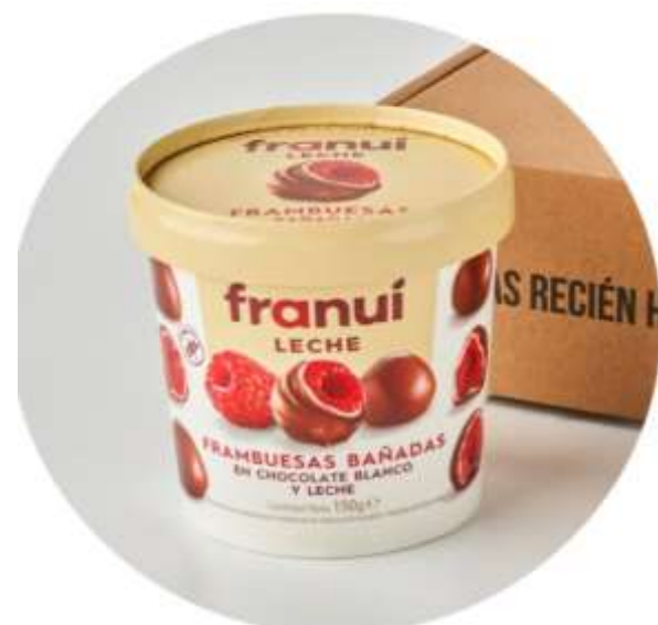
CHOCOLATE COM LEITE