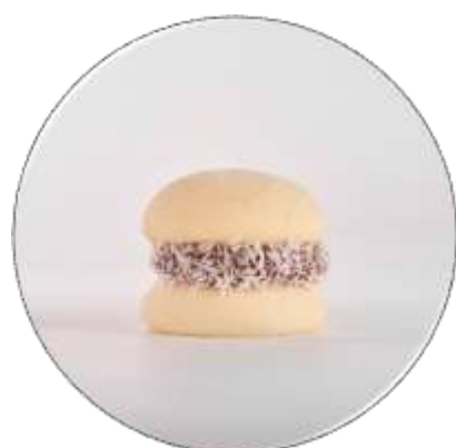
ALFAJOR DE MAICENA